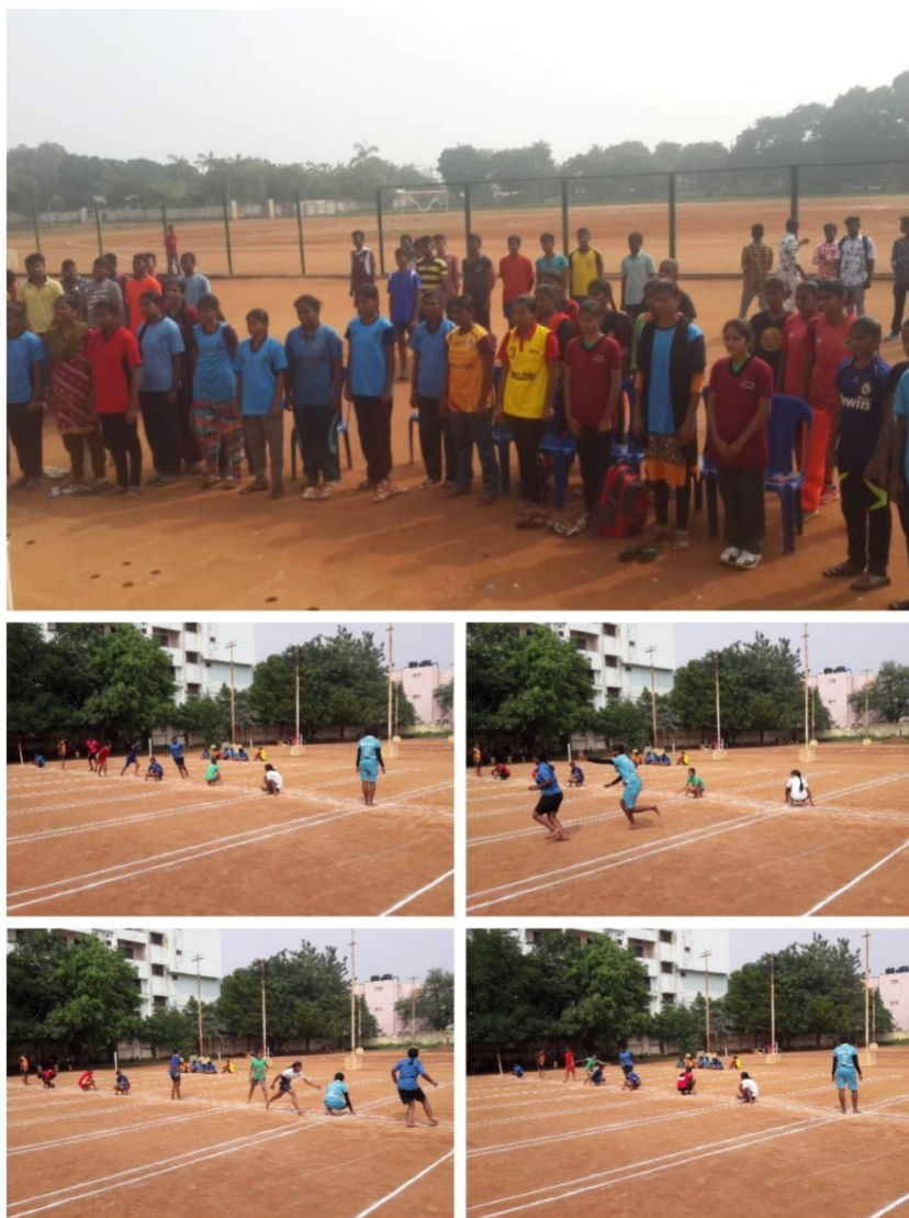
Students participating in district level games and sports meet

INDIAN RED CROSS SOCIETY and YOUTH RED CROSS , Nellore organized District Level Games and Sports Meet on 10/12/2018. YRC Committee members of D.K.Govt College for Women (A), Nellore encouraged college students to take part in this sports meet. 40 students participated in this meet and secured prizes in different athletic competitions along with Kho-Kho.